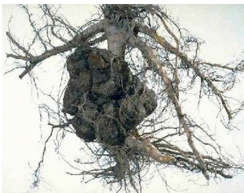
Tumore radicale ( Agrobacterium tumefaciens )