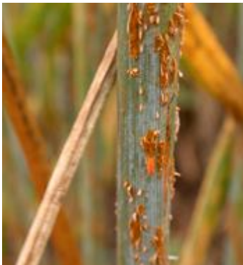
Ruggine del grano ( Puccinia graminis )