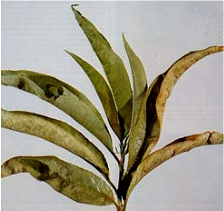
Marciume fibroso ( Armillaria mellea )